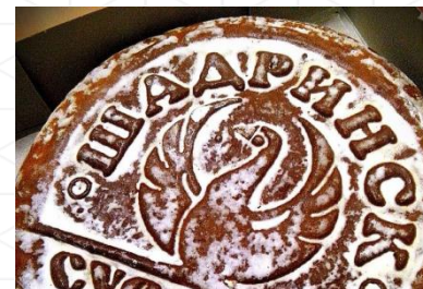
ШАДРИНСКИЙ ПРЯНИК (Курганская область)