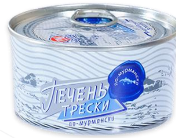
ПЕЧЕНЬ ТРЕСКИ ПО-МУРМАНСКИ (Мурманская область)