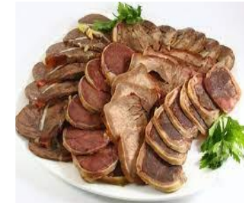
КАЗЫ ГОРНОГО АЛТАЯ (Республика Алтай)