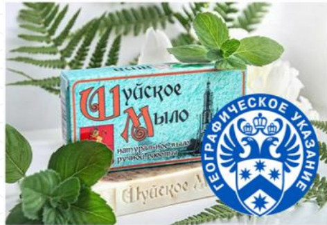
ШУЙСКОЕ МЫЛО (Ивановская область)

По состоянию на 22.11.2022 зарегистрировано 33 ГУ, среди которых