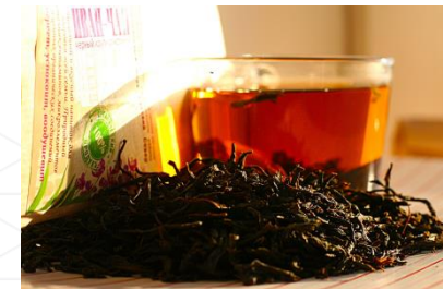
ВОЛОГОДСКИЙ ИВАН-ЧАЙ (Вологодская область)